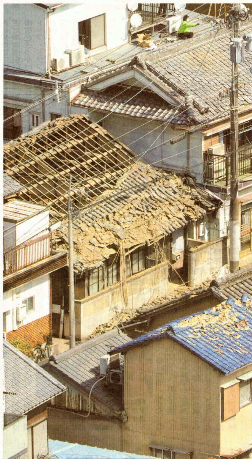
強い揺れで瓦が落ちた民家―兵庫県洲本市で13日午前9時36分

◆ 大阪府で民家の土壁が崩れたり、水道管が破損するなどした。大阪ガスによると、安全装置が作動するなど近畿2府3県で約6万件のガス供給が止まった。 交通機関にも影響が出た。JR各社によると、始発から運転を見合わせた山陽新幹線・新神戸―岡山間 うと自宅窓から飛び降りた淡路市の男性(84)が足を骨折▽兵庫県明石市と福井県敦賀市で高齢女性がベッドから落ちて腰などを骨折―など、けが人が相次いだ。各府県などによると、正午現在のけが人は重傷7人、軽傷16人の計23人。